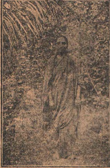
கந்திகல்மெட்டு கொம்பல்லி ஆண்டாளம்மா ஹைதராபாத்

விஷயம் வெகு அவலேபத்துடன் விஜ்ஞாபிக்கிறேன்;— விரலுக்குத் தகாத வீக்க மென்னும்படி அடியேன் ஸ்வசத்தியை மீறி ஸாஹஸமாகவே எவ்வளவு பெரிய காரியங்களை ஆரம்பித்தாலும் அவற்றை அநாயாஸமாகத் தலைக்கட்டிக் கொண்டு போகிறவன் எம்பெருமான். விசேஷித்து இந்த தைவபலம் அடியேனுக்குள்ளது.